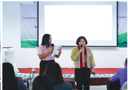
อภิปรายหัวข้อ “การบริหารจัดการห้องเรียนเชิงบวก” ตามกลุ่มสาระการเรียนรู้รายวิชา