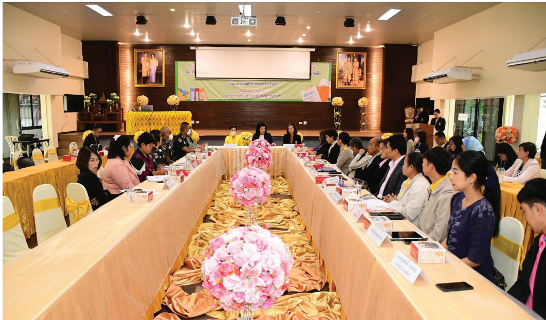
การจัดอบรมเชิงปฏิบัติการ วันที่ 20 กุมภาพันธ์ 2567 ณ ห้องกระแสด มหาวิทยาลัยราชภัฏวชิรเวศน์