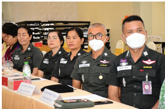
การจัดอบรมเชิงปฏิบัติการ วันที่ 20 กุมภาพันธ์ 2567 ณ ห้องกระแจะ มหาวิทยาลัยราชภัฏราชชนดิรินทร์