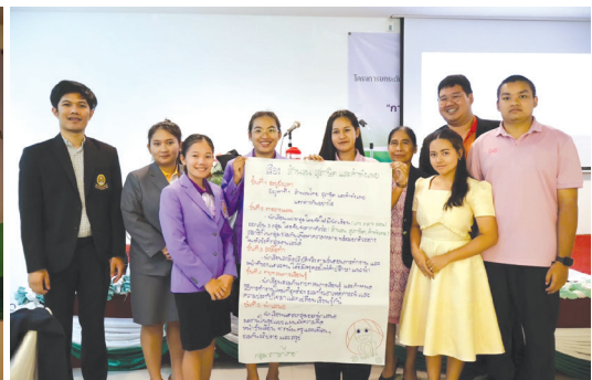
อภิปรายหัวข้อ “ปรับกระบวนการทัศน์ : การจัดการเรียนรู้เชิงรุกโดยใช้โครงงานเป็นฐาน ”