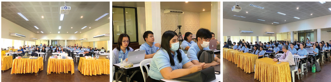
การจัดอบรมเชิงปฏิบัติการ วันที่ 11 พฤษภาคม 2567 ณ ห้องกระแสด มหาวิทยาลัยราชภัฏราชนครินทร์